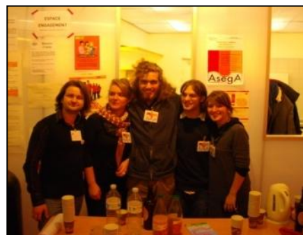
[Buvette à la journée de l'ESS de l'Atelier]

Notre email : asega.parisouest@gmail.com