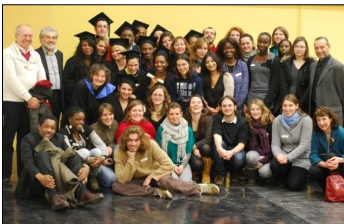
[Remise de diplômes Promotion 2010/2011]